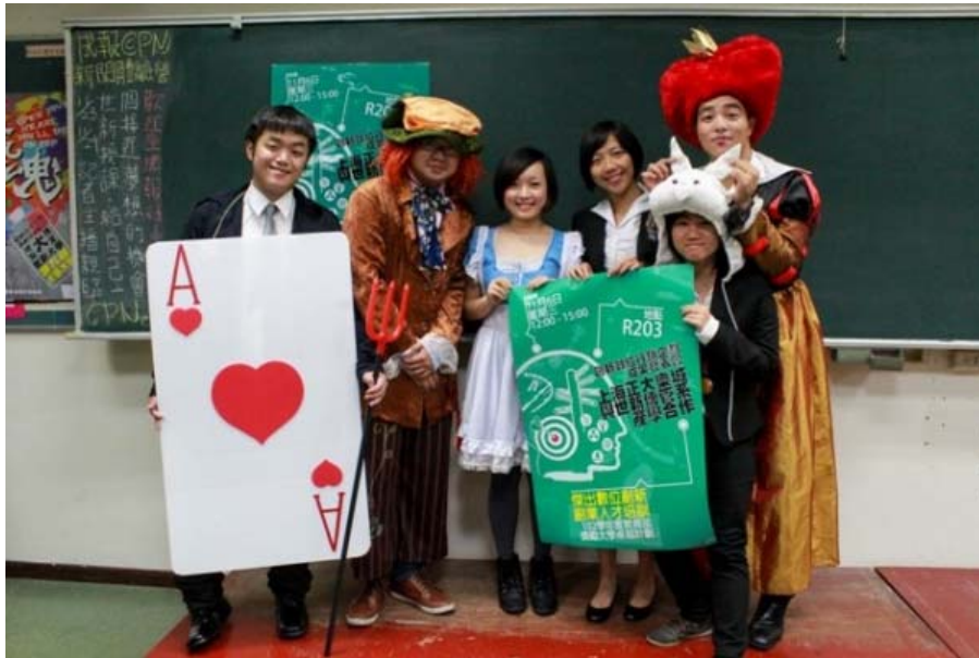
圖五：「腦子一起RUN」小組的創意、服裝都讓人眼睛為之一亮，果然獲得「賣場情境設計」首獎。