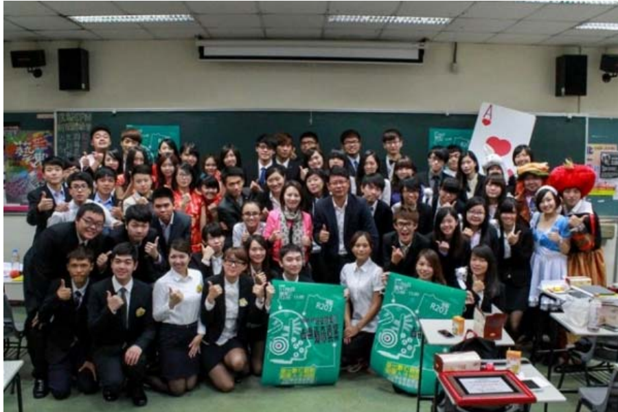
圖二：正大樂城將招攬表現優異學生前進上海工作。