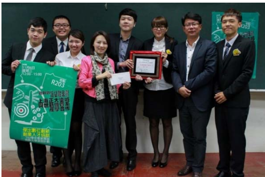
圖四：「Should Be Fun」小組獲得「年節節慶行銷」第一名。